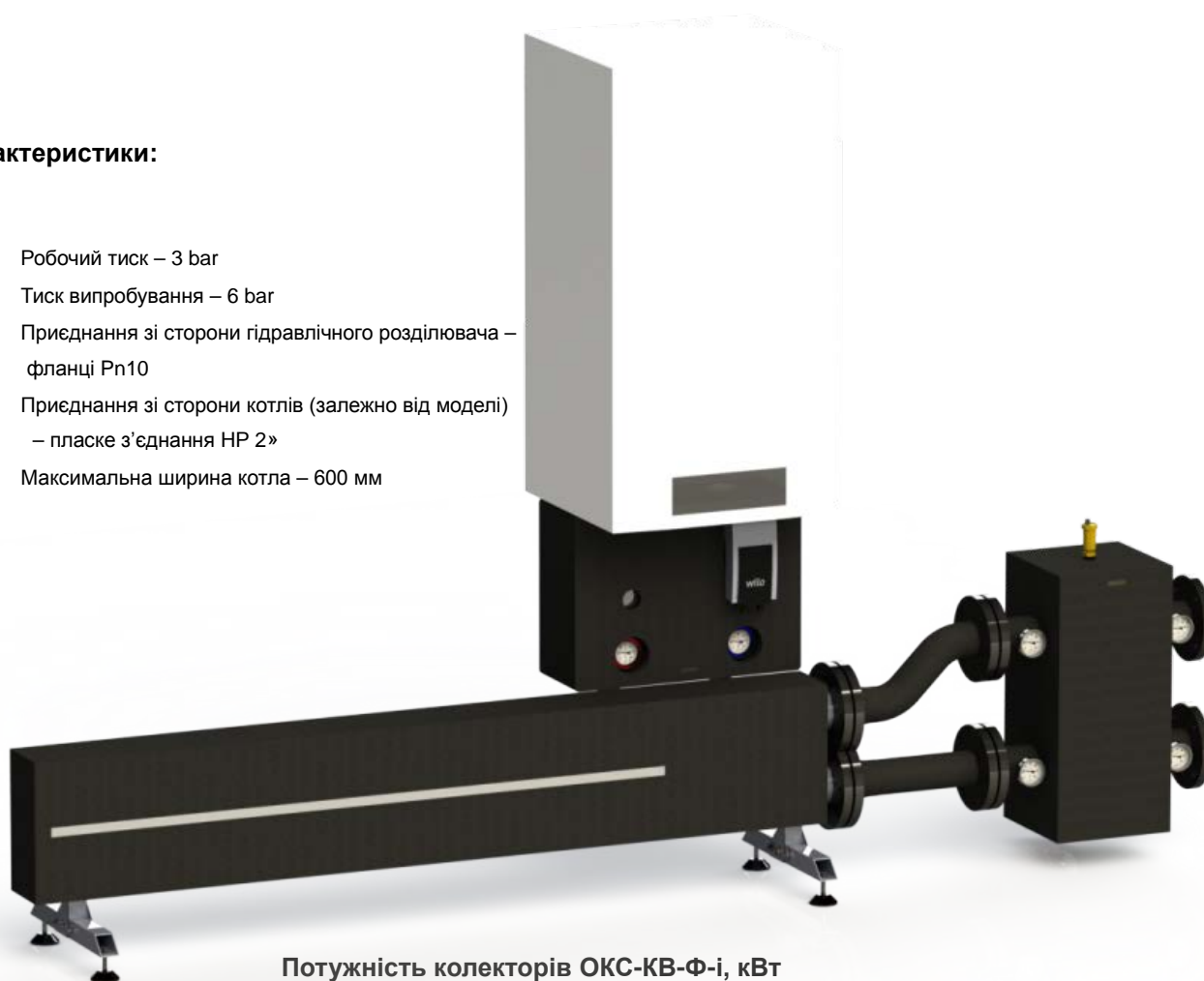
Потужність колекторів ОКС-КВ-Ф-і, кВт